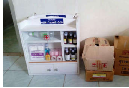
มอบตุ้มยาและเวชภัณฑ์ประจำโรงเรียน