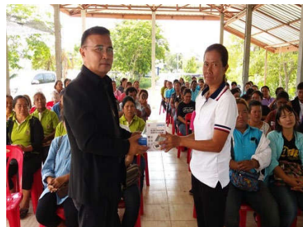
มอบเครื่องตรวจวัดความดันโลหิตประจำหมู่บ้าน