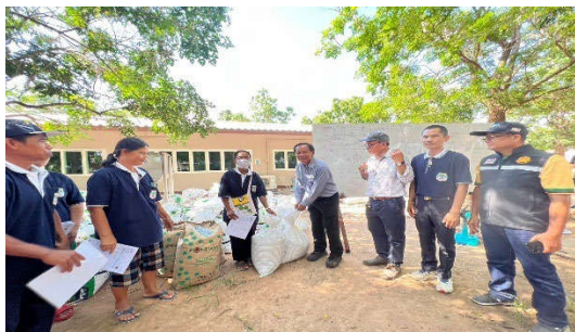
การจัดหาปุ๋ยให้แก่เกษตรกร