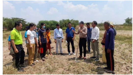
ลงพื้นที่เก็บตัวอย่างดิน ครั้งที่ 1