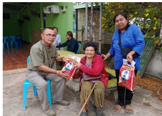
รูปที่ 5-5 โครงการน้ำใจไทยคาลิ