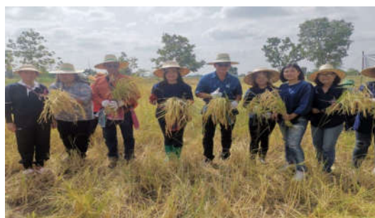
รูปที่ 5-2 โครงการลงแขกเกี่ยวข้าววิถีชาวนาตำบลหนองไทร