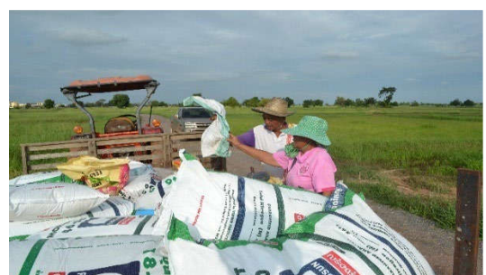
การใช้ปุ๋ยเพื่อเพิ่มผลผลิต