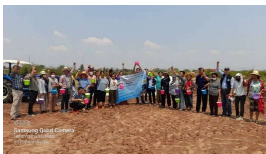
ประธานความร่วมมือกับหน่วยงานที่เกี่ยวข้อง