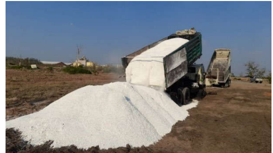
ได้รับวัสดุปรับปรุงดิน - ยิปซัม