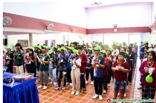
รูปที่ 5-3 โครงการเยาวชน ยุคใหม่ใส่ใจสิ่งแวดล้อม