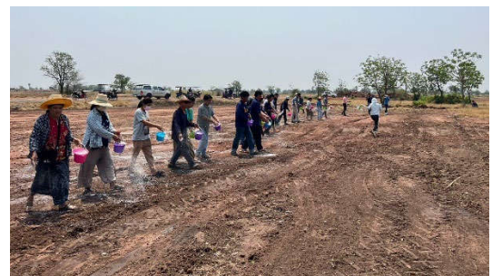
การเตรียมแปลงสาธิต