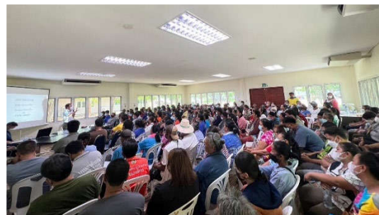
รูปที่ 5-6 โครงการส่งเสริมอาชีพและคุณภาพชีวิตของชุมชน