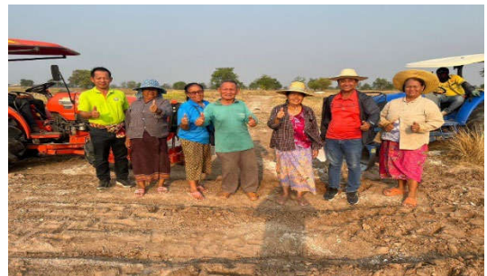
ตรวจสอบแปลงเกษตรกรที่เข้าร่วมโครงการฯ