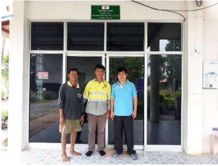
ปรับปรุงห้องฉุกเฉิน