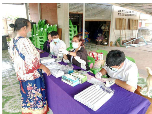
รูปที่ 5-9 โครงการตรวจสุขภาพประชาชนบริเวณโดยรอบพื้นที่โครงการ