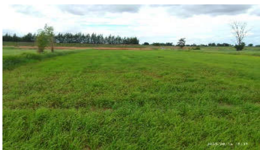
สภาพหลังปรับปรุงดิน