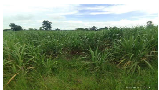
สภาพหลังปรับปรุงดิน

รูปที่ 5-1 (ต่อ) โครงการวิจัย พัฒนา แก้ไข ปรับปรุงปัญหาดินเค็มตามแนวพระราชดำริ เศรษฐกิจพอเพียง