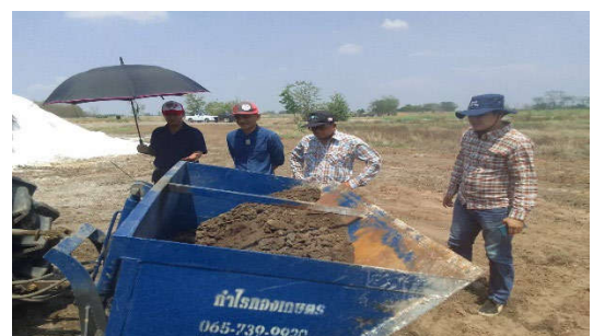
การไถกลบซี้เค้กปรับปรุงดิน