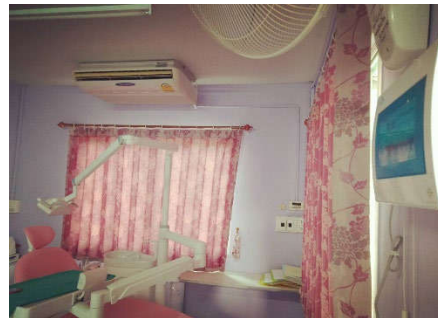
โครงการปรับปรุงห้องทันตกรรม