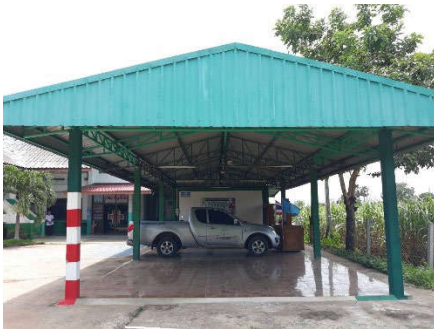
โครงการปรับปรุงห้องประชุมศาลาให้บริการ