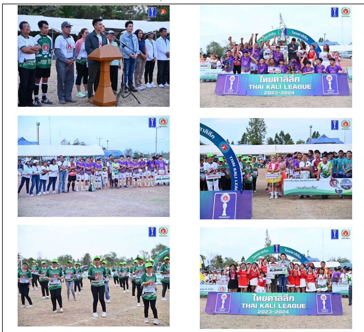
รูปที่ 5-7 โครงการแข่งขันฟุตบอล “ไทยคาลิ ลีก”

นอกจากนี้คณะกรรมการกองทุนมวลชนสัมพันธ์ได้ประชาสัมพันธ์ข้อมูลข่าวสารเกี่ยวกับโครงการ การติดตามตรวจสอบผลกระทบ รวมทั้งรับเรื่องราวร้องเรียนต่างๆ ของชุมชนในเขตพื้นที่ประทานบัตรและ นำเข้าที่ประชุมเพื่อกำหนดแนวทางแก้ไข เพื่อนำเสนอต่อโครงการในการปรับปรุงแก้ไขหรือดำเนินกิจกรรมที่ สอดคล้องกับความต้องการของชุมชน เพื่อสร้างความสัมพันธ์ที่ดีระหว่างโครงการกับชุมชนอย่างยั่งยืน