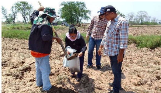
การลงพื้นที่เก็บตัวอย่างดิน ครั้งที่ 2