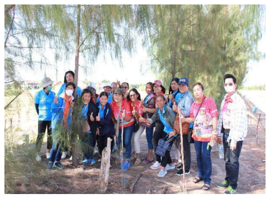
รูปที่ 5-4 โครงการผู้นำชุมชนกับการสร้างความรู้ความเข้าใจการทำเหมืองแร่โปแตชและการดูแลสิ่งแวดล้อม