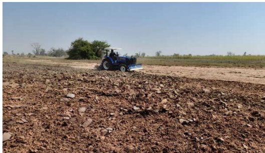
ไถพรวนดินเตรียมแปลงสาธิต