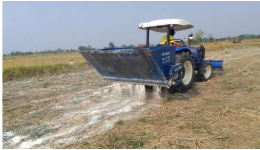
การไถกลบวัสดุปรับปรุงดิน