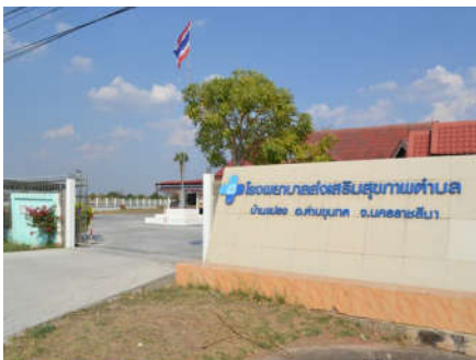
ก่อสร้างลานจอดรถพื้นคอนกรีต