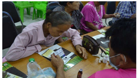
การเตรียมดินและตรวจวิเคราะห์ตัวอย่าง