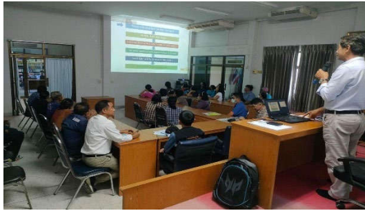
การประชุมเริ่มโครงการฯ