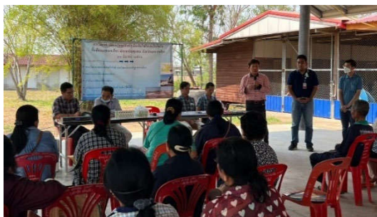
การบรรยายให้ความรู้ดินเค็มแก่เกษตรกร